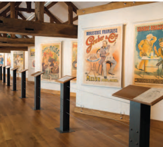
De reclame tentoonstelling